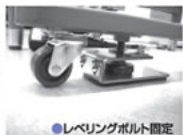
●レベルングボルト固定