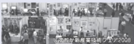
しずおか新産業技術フェア2009

当社展示品 LED照明、帯電防止剤、消臭剤 ナノモップ、NTNベアリング SMCイオナイザ等、THK免震テーブル