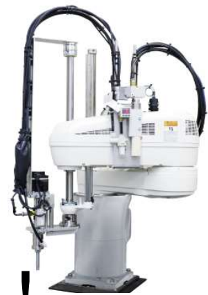
● ナットランナーを使ったねじ締めシステム