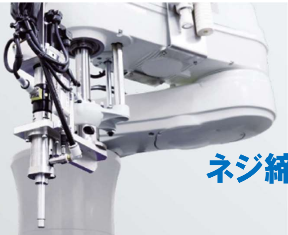
● デンソーウェーブ製ねじ締めロボット